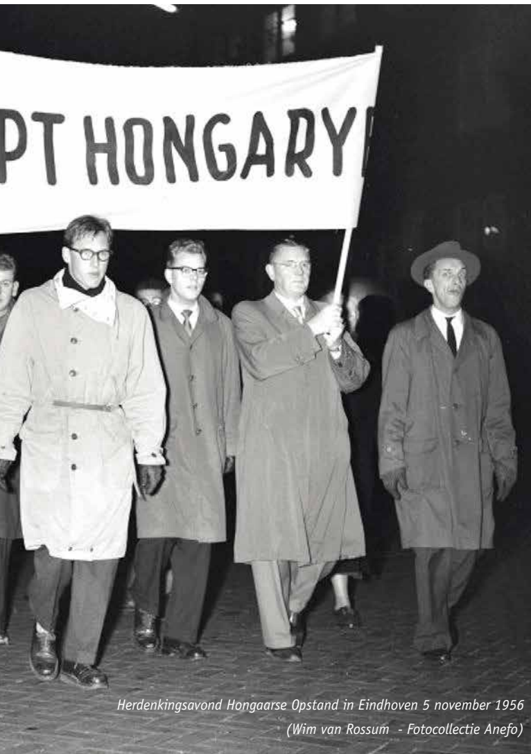
Herdenkingsavond Hongaarse Opstand in Eindhoven 5 november 1956

In de hele wereld wordt geschokt gereageerd op het neerslaan van de Hongaarse Opstand door de Sovjet-Unie. De Nederlandse bevolking is verontwaardigd en woedend. Door het verdriet