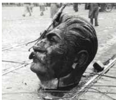
Het neergehaalde standbeeld van Stalin

In alle lagen van de samenleving verzet men zich tegen de dictatuur en in het hele land worden anticommunistische groepen opgericht. Burgers die zich tegen het communistische regime verzetten kunnen opgepakt worden door de Hongaarse Staatsveiligheidsautoriteit (ÁVH). Tot 1956 zijn arrestaties dan ook aan de orde van de dag en worden er ongeveer 400 mensen geëxecuteerd.