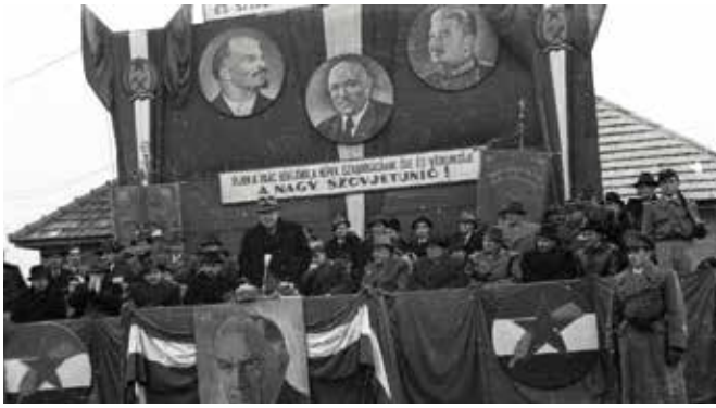
Opening snelweg door minister van Verkeer (afbeeldingen van Lenin, Stalin en Rákosi op achtergrond)