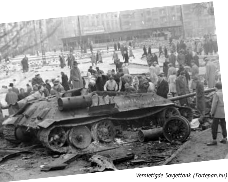
Vernietigde Sovjettank

snelle overwinning. Hongaarse vrijheidsstrijders, gewapend met slechts lichte wapens, dwingen de Sovjettanks echter om zich terug te trekken. Ze smeren wegen in met zeep zodat Russische tanks wegslijpen, bouwen barricades van stoeptegels, gooien met molotovcocktails en sturen elkaar in het geheim berichten over de locaties van tanks.