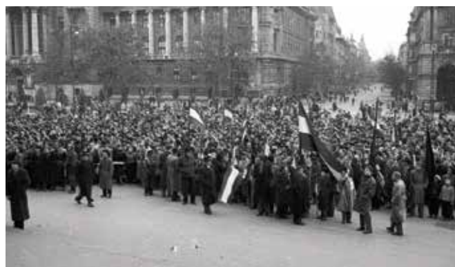
Protest op het parlamentsplein

Sovjetroepen die gestationeerd zijn in Hongarije, vallen de volgende ochtend Boedapest binnen. Het leger hoopt op een