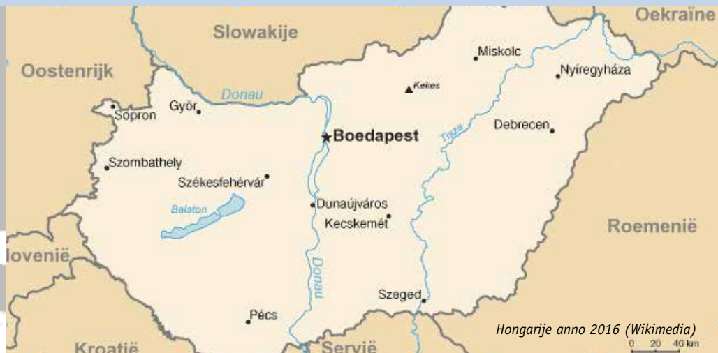
Hongarije anno 2016