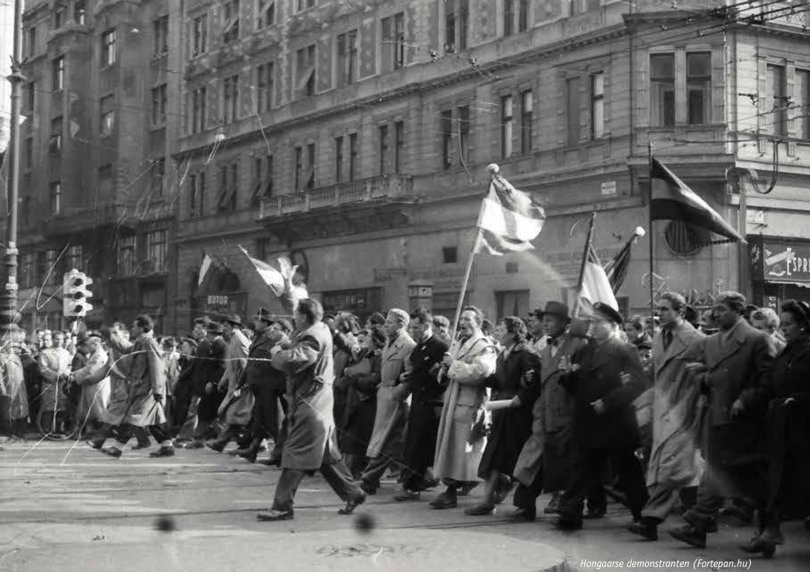
Hongaarse demonstranten