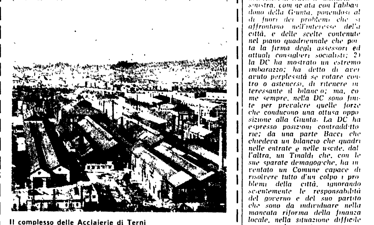
Il complesso delle Acciaierie di Terni

Terni: oggi si vota all'Acciaieria Dalla nostra redazione