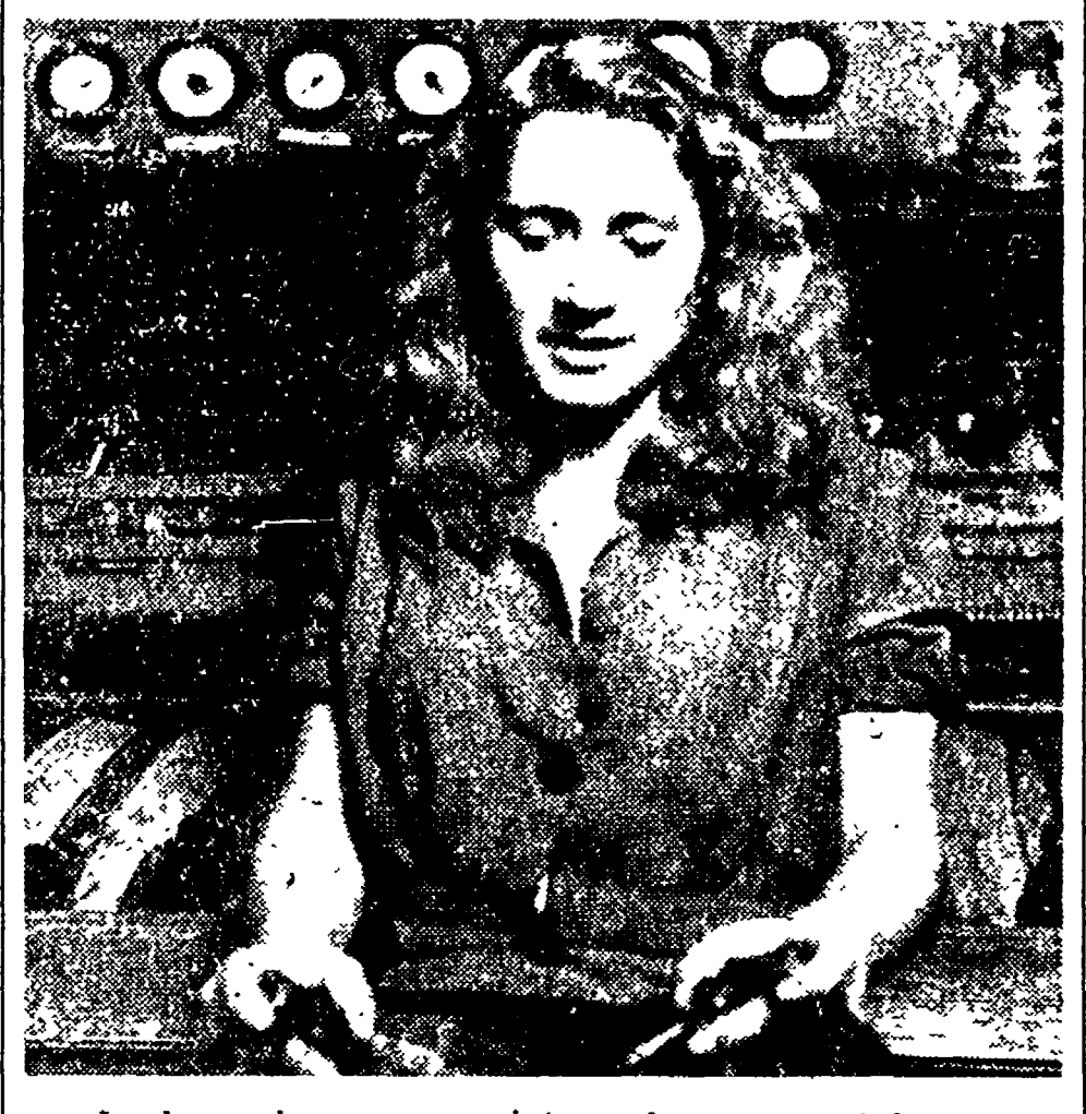
Le donne si sono pronunciate per la pace e per il lavoro

Al grande movimento per la pace e l'indipendenza nazionale, la ripresa produttiva hanno dato la loro adesione e il loro appoggio le donne italiane.