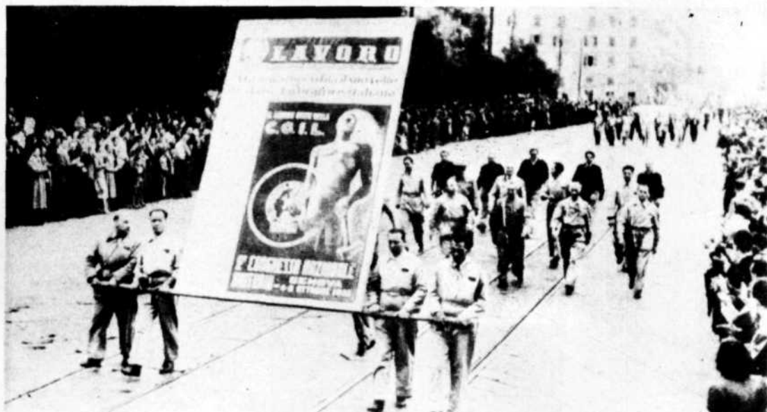
Genova, ottobre 1949: delegazioni di lavoratori sfilano per le vie della città. Nella foto: un cartello propagandistico del «Lavoro» il settimanale della Cgil