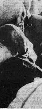
Stoccolma. Il luogo dell'assassinio di Olof Palme è trasformato e ricoperto di fiori. Nella foto, una signora vi lancia una rosa