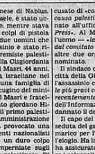
Il sindaco di Nablus ucciso, Jaffar Al Masri

TEL AVIV - Il sindaco palestinese di Nablus, nella Cigriordania occupata da Israele, è stato ucciso ieri mattina, poco dopo le otto, mentre stava per entrare in municipio, con tre colpi di pistola esplosi a distanza ravvicinata da due uomini che poi si sono dati alla fuga. L'assassino è stato rivendicato dalle organizzazioni estremiste palestinesi. Nablus è la maggiore città della Cigriordania occupata e il suo sindaco, Jaffar al Masri, 42 anni, era stato nominato dalle autorità israeliane nel novembre scorso. Discendente di una famiglia di notabili palestinesi, il sindaco era cugino del ministro degli Esteri, giordano Taber al Masri e fratello dell'ex presidente del Parlamento giordano Hussein al Masri. Al Masri era stato il primo palestinese da quattro anni a dirigere l'amministrazione municipale: la sua nomina aveva provocato una grande controversia in certi ambienti nazionalisti palestinesi. L'omicidio ha inflitto un duro colpo alle iniziative di pacificazione impiegate dagli israeliani moderati del movimento palestinese. Di lui Masri erano note le posizioni vicine a quelle del governatore per la soluzione del conflitto arabo-israeliano e della questione palestinese. Aveva rifiutato la carica di sindaco il 19 dicembre da un ufficiale dell'esercito israeliano, con l'approvazione di Re Hussein e del presidente dell'Olp Arafat.