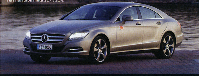
Mercedes-Benz CLS 350 CDI

Perushinta 83 529 € Vertailuauton hinta 117 721 €