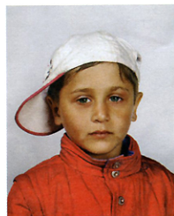
Ei henkilöpapereita, 4 vuotta, Italia