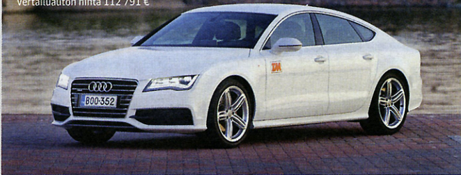
Audi A7 Sportback 3,0 TDI (180 kW) Quattro S tronic

Perushinta 79 998 € Vertailuauton hinta 112 791 €