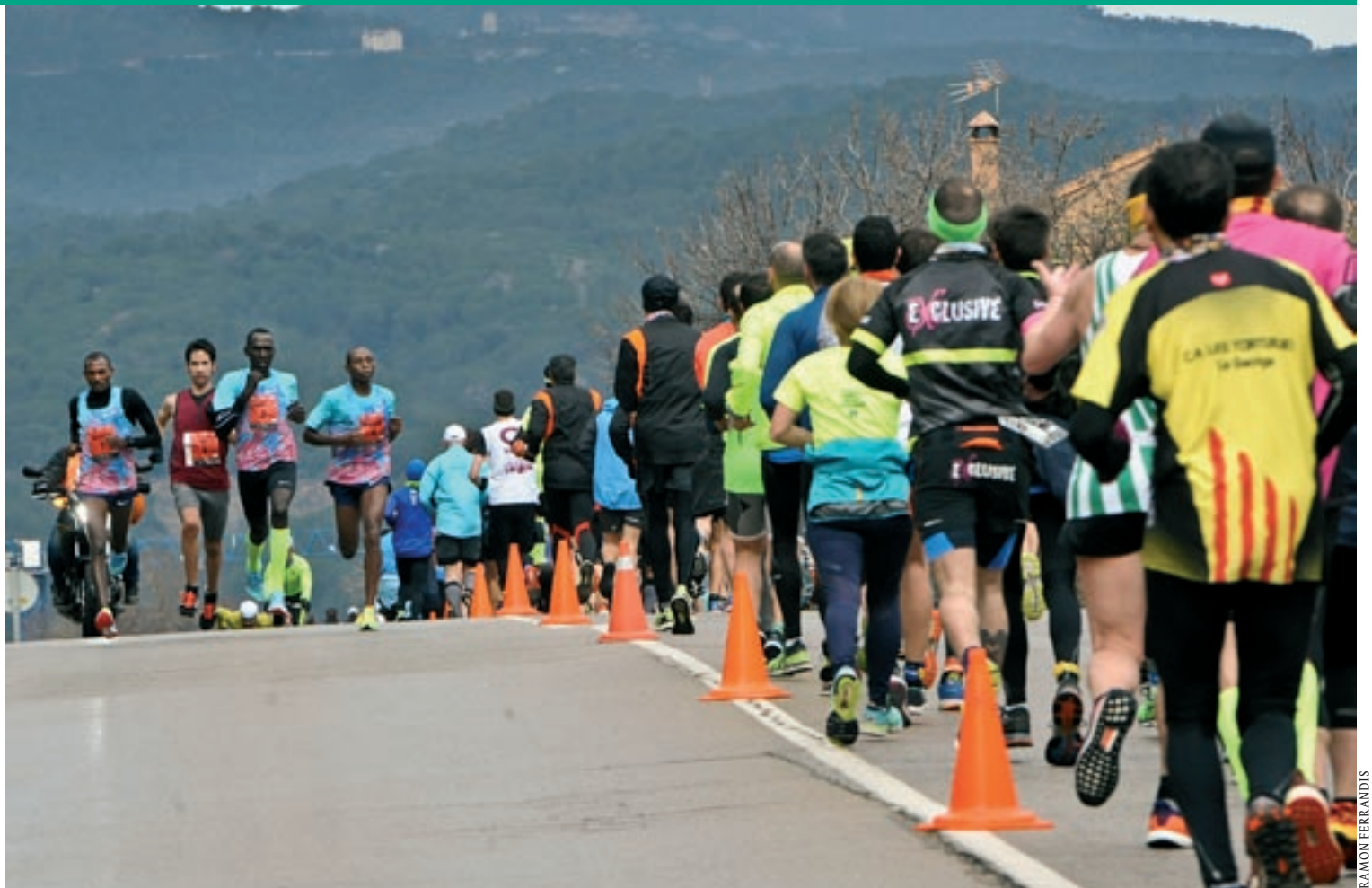
Els atletes tornen a creuar-se a la Mitja, en aquest cas entre Can Tamayo i el pont dels Gorgs a la Garriga

El KH-7 BM Granollers torna de València amb victòria (24-28)