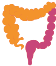
LEFT-SIDED (DISTAL) COLITIS