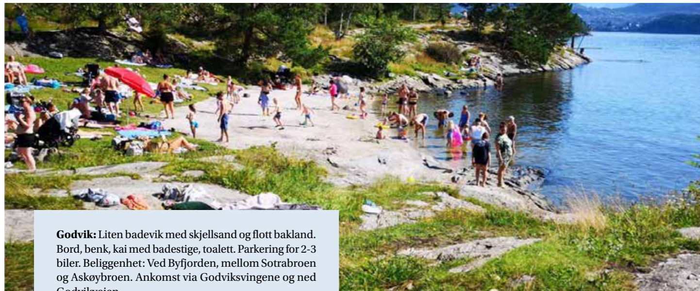
Godvik: Liten badevik med skjellsand og flott bakland. Bord, benk, kai med badestige, toalett. Parkering for 2-3 biler. Beliggenhet: Ved Byfjorden, mellom Sotrabroen og Askøybroen. Ankomst via Godviksvingene og ned Godvikveien.

Tennebekktjørna: Større badeområde med to flotte sandstrender. Toalett, lekeplass, begrenset parkering i Nipedalen, men gode parkeringsmuligheter i Lappeleiren. Beliggenhet: Innfallspørt til Kanadaskogen, med turvei rundt vannet. God adkomst på turvei fra Fyllingsdalen og Lappeleiren. Bussforbindelse til Nipedalen.