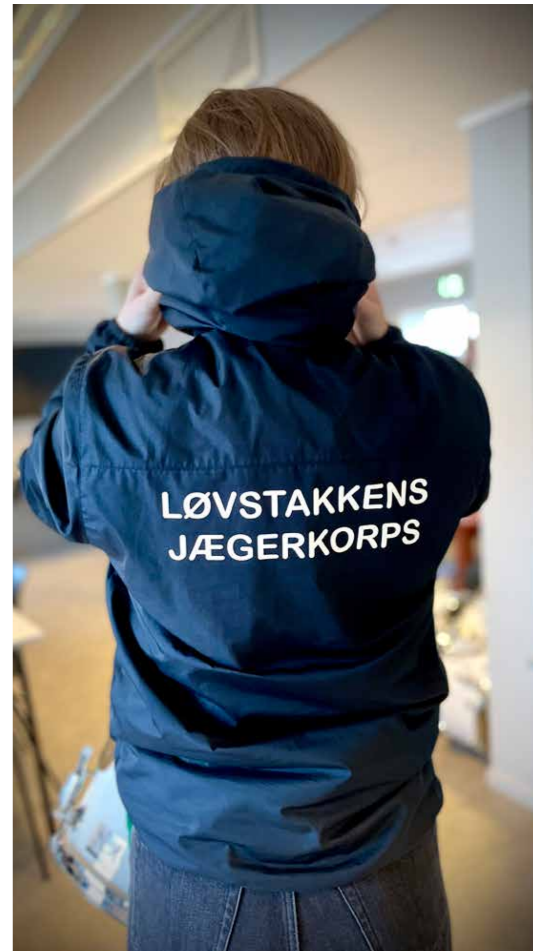
INKLUDERENDE: Buekorpset mottok Bergen Kommunes Kulturpris i 2021.