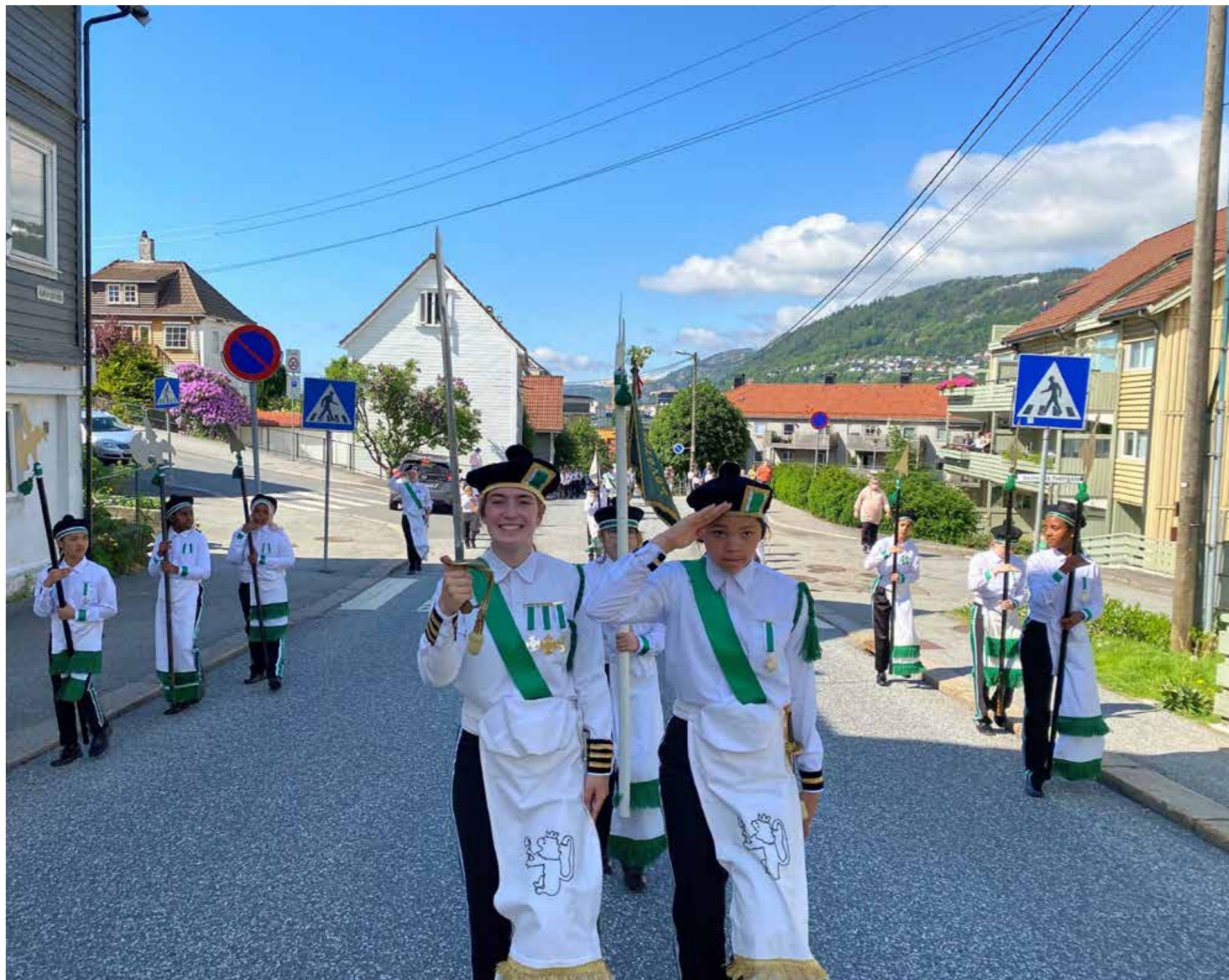
VANDRER SAMMEN: Uansett alder og nasjonalitet er alle barn og unge hjertelig velkommen i Løvestakkens Jægerkorps.