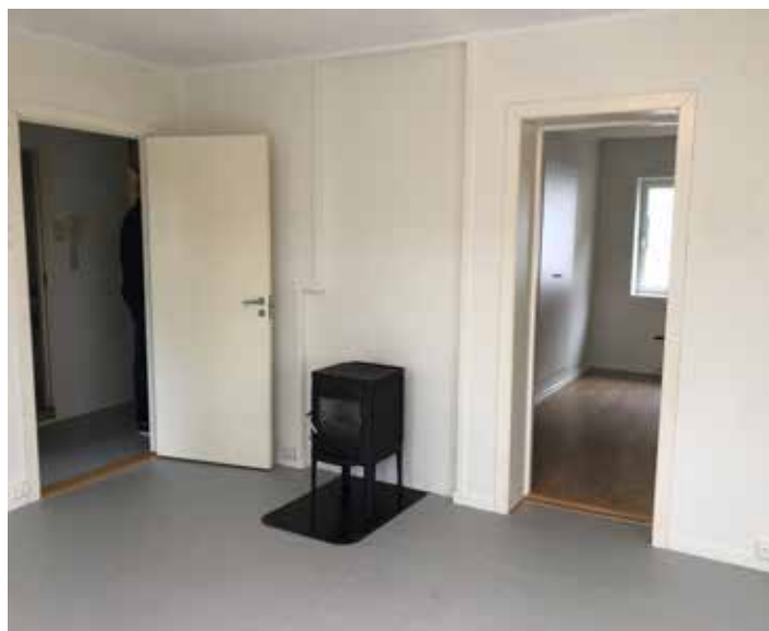
LØVSTAKKVEIEN, FØR OG ETTER: Bergen kommune har nå pusset opp leilighetene i Løvstakkveien 27 og 29. Blant annet er planløsningene endret fra separat kjøkken og stue til en åpen løsning.