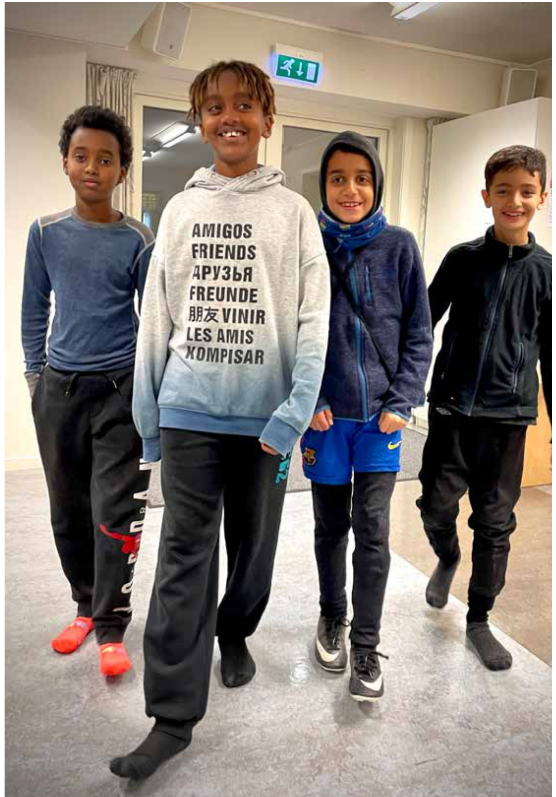
PHOTOSHOOT I STUEN: Femmer-guttas «bandposering» står definitivt til terningkast seks!