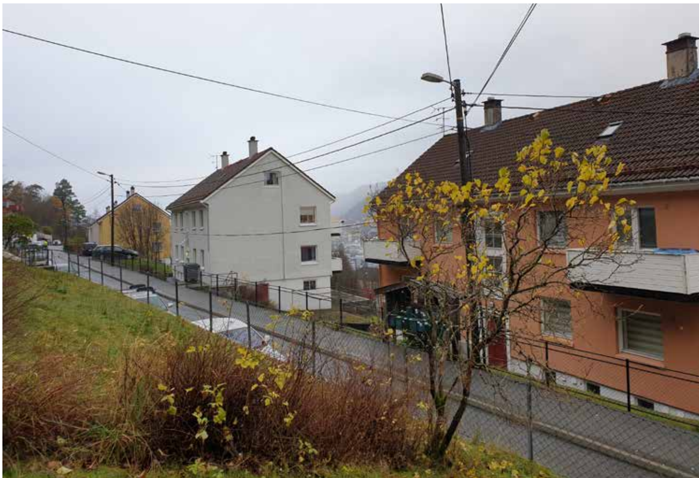
LØVSTAKKLIE: Bergen kommune skal pusse opp alle leilighetene i disse boligene, og utvide flere av dem fra treroms- til femromsleiligheter.