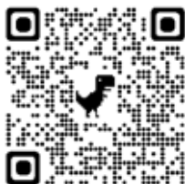
QR kode til EBF nettadresse