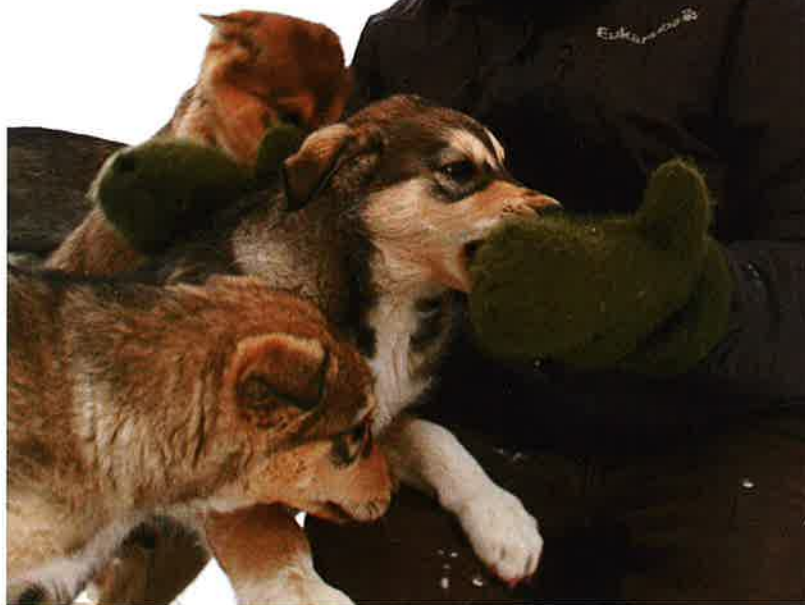
Kontakt med hundene er viktig

– Så lenge jeg har det gøy, hundene har det fint og det går rundt så holder jeg på!