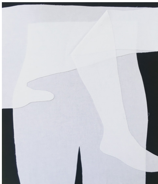
Gerda Scheepers, Fabric Actors, (1) 2017 Fabric collage, 78 × 56 cm.