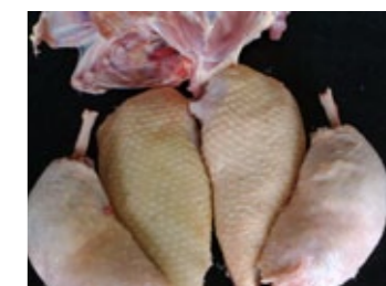
9 Les cuisses et les filets (ou magrets) sont prêts à cuire. La carcasse sera utile pour réaliser un jus.