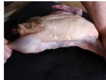
1 Étirez le canard ou la canette.