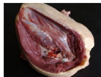
7 Longez la cage thoracique...