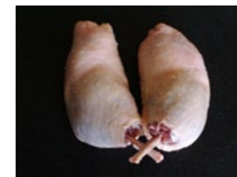
5 Manchonnez les cuisses (dégagez la chair qui recouvre les os et grattant ceux-ci et en les coupant).