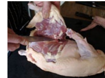
3 Incisez la peau le long de la carcasse...