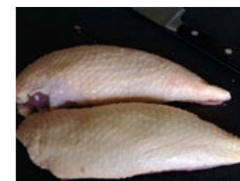
8 ... et prélevez les filets (ou magrets).