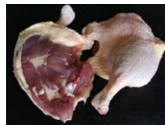
4 ... pour lever les cuisses.