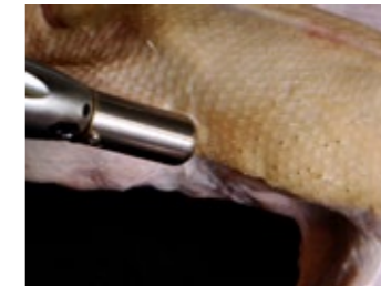
2 Éliminez les plumes et duvets restants (à l'aide d'un chalumeau de cuisine).