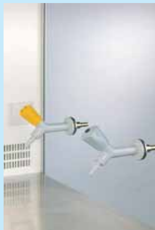
Espitas para gas, vacío o nitrógeno (opcional)