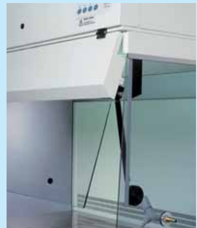
Frontal con elevadores de pistón neumático en cristal templado que facilita el acceso