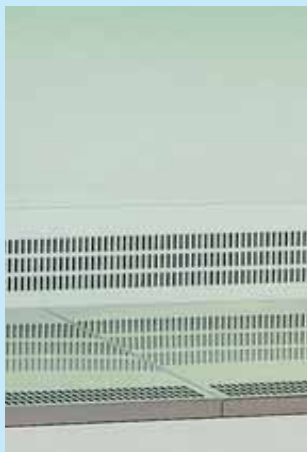
Zona de trabajo en acero inoxidable de fácil limpieza