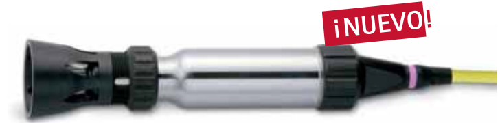
Electrodo de pH, robusto, de acero inoxidable, con cable de 5, 10, 15 ó 30 m