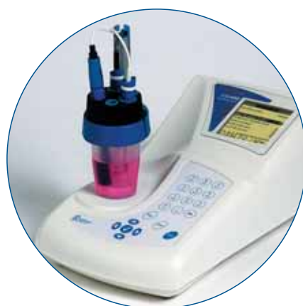
ION 450 – tecnología punta para el análisis de iones