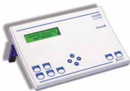
PHM 220 – el pHmetro de laboratorio universal

La filosofía METERLAB representa la analítica excelente de laboratorio para pH, conductividad e iones (ISE). Medidores, electrodos y accesorios forman la gama de productos METERLAB, basada en componentes adaptados entre sí. METERLAB proporciona calidad en la fiabilidad de los valores medidos y la fácil ejecución del análisis. El resultado: cuando Usted elige METERLAB, automáticamente elige GLP.