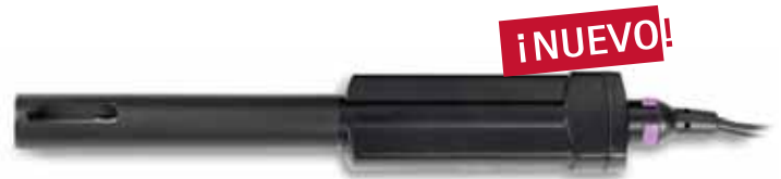
Electrodo de conductividad, estándar, con cable de 1 ó 3 m