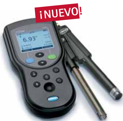
Gama de productos HQD/INTELLICAL → Véase la página 19

En el tratamiento de aguas residuales y potables, así como en el aseguramiento de la calidad, el pH es la base para todos los análisis. La conductividad y el oxígeno pueden jugar también un papel importante en muchas aplicaciones, tanto en campo como en el laboratorio. Debido a la gran demanda de estos parámetros, los productores tienen que ofrecer una amplia gama de productos para satisfacer las necesidades de sus clientes. Aquí es donde HACH LANGE es más fuerte, con más de 50 años de experiencia y 3 gamas completas de producto, con medidores, electrodos y accesorios.