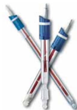
Extensa oferta de electrodos – con tecnología RED ROD para tiempos de respuesta cortos y gran precisión