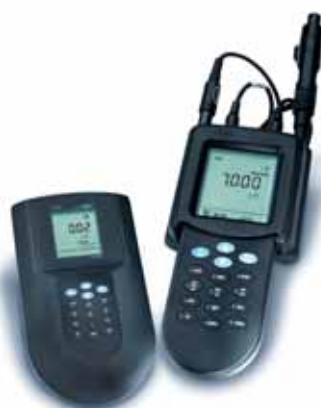
Gama de productos SENSION → Véase la página 24