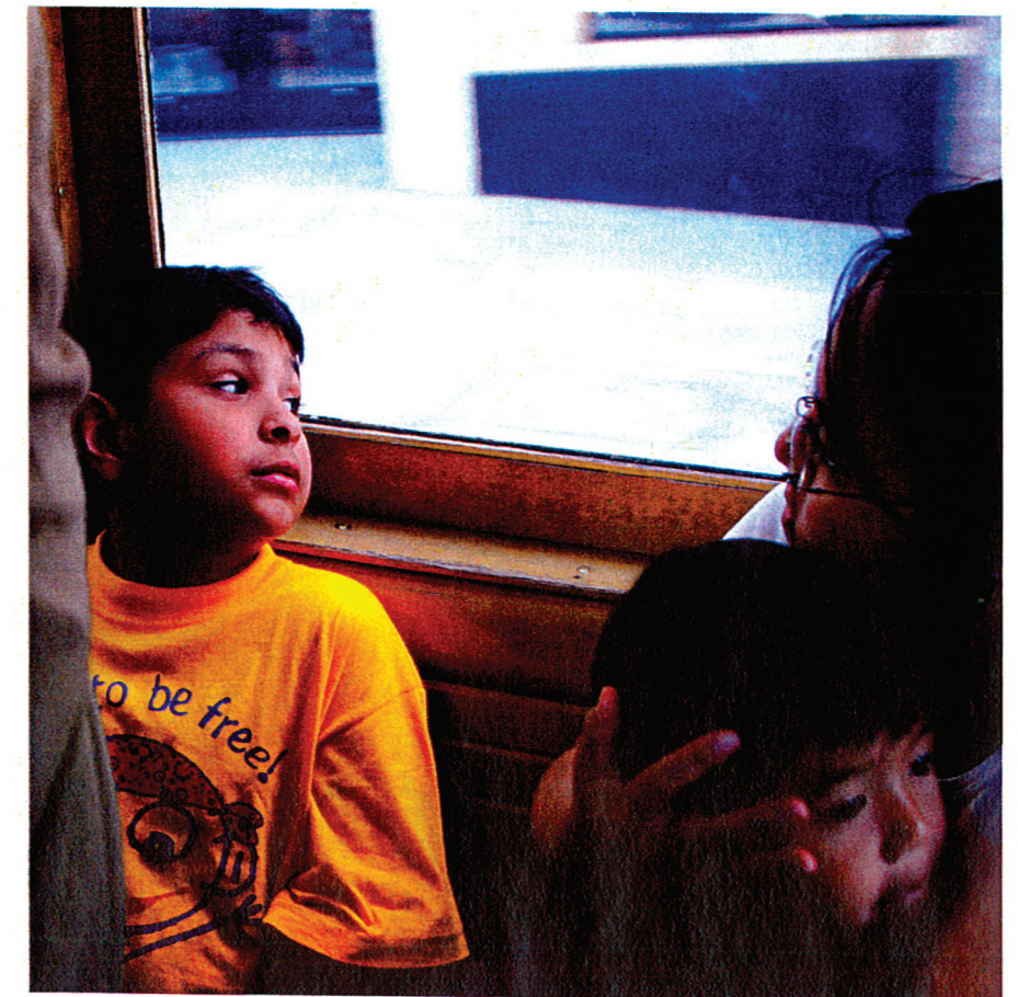
Ikkunasta tuleva pilvisen päivän valo luo rauhallisen tunnelman pojan kasvoille.

”Älä luovuta, vaan jatka sinnikkäästi. Kaikkialla tapahtuu mielenkiintoisia asioita ja kaikkialta löytyy mielenkiintoisia ympäristöjä – ne pitää vain nähdä!”