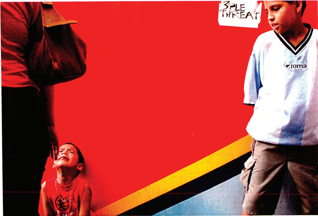
Itkevän lapsen ilme ja äidin ojentuva käsi kertovat tilanteesta paljon. Voimakkaita tunteita korostavat taustan punainen väri sekä toisen pojan katse.