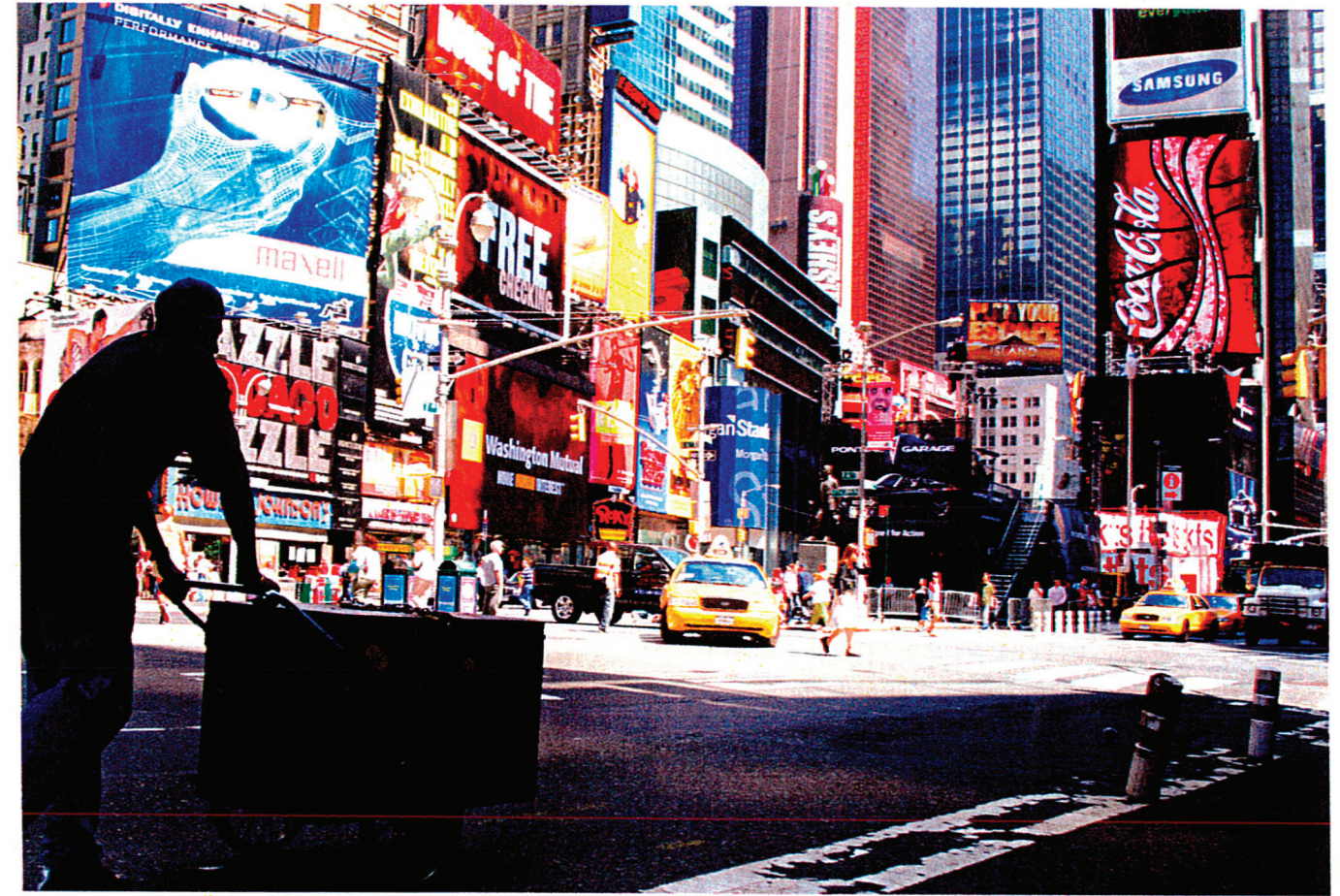
Taustan värikkyys ja valoisuus luo voimakkaan kontrastin etualan varjolle ja värittömyydelle.