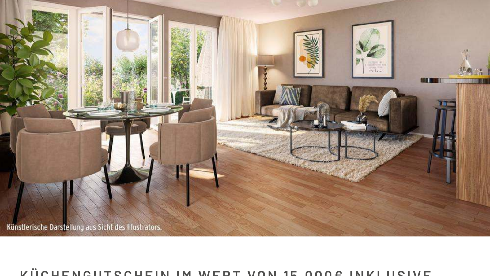
Künstlerische Darstellung aus Sicht des Illustrators.

089 / 66 59 60 | 0152 /33 84 29 29 (Herr Sam Dose)