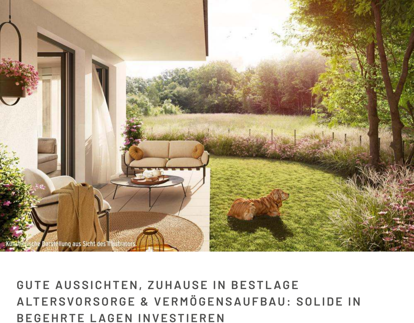
Künstlerische Darstellung aus Sicht des Illustrators

Zeitlos elegante Bäder mit vielen Annehmlichkeiten wie Handtuchwärmer und einer hochwertigen Markenausstattung garantieren einen entspannten Start in den Tag und erholsame Abende in der eigenen Wellnessoase.