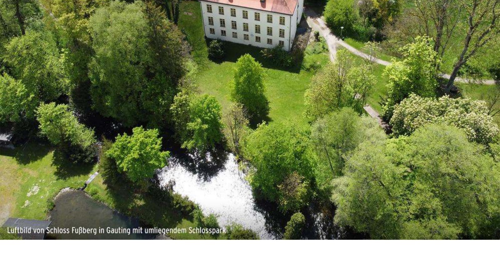
Luftbild von Schloss Fußberg in Gauting mit umliegendem Schlosspark

In herrlich grüner und ruhiger Lage wird derzeit unser angenehm überschaubares Wohnensemble AM SCHLOSSPARK im beliebten Fünfseenland fertiggestellt. Der direkte Zugang zu den weitläufigen Würm-Auen und dem Schlosspark in Gauting machen diese Top-Lage so begehrt.