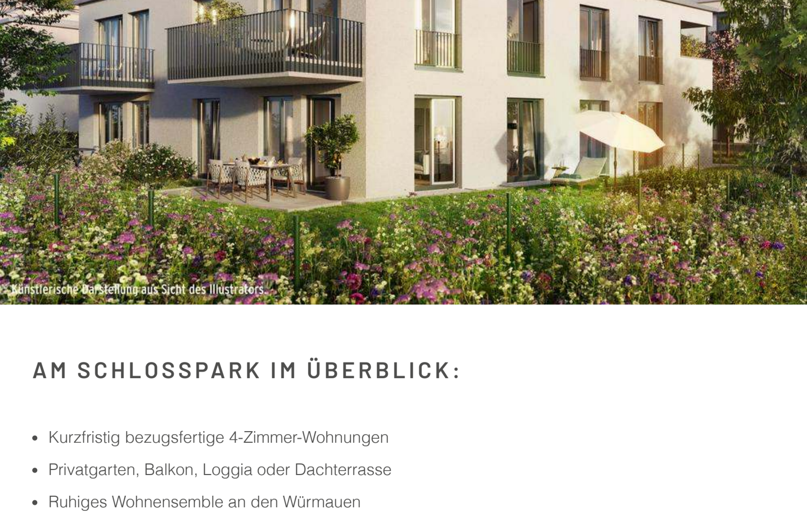
Künstlerische Darstellung aus Sicht des Illustrators

Mit ca. 20.000 Einwohnern hat Gauting zudem die perfekte Gemeindegröße, um alle Dinge des täglichen Lebens abzudecken. Flächendeckende Versorgung mit Ärzten, Apotheken, einer renommierten Lungenklinik vor Ort, knapp 20 Kitas und Kindergärten und fast genauso viele private und staatliche Schulen.