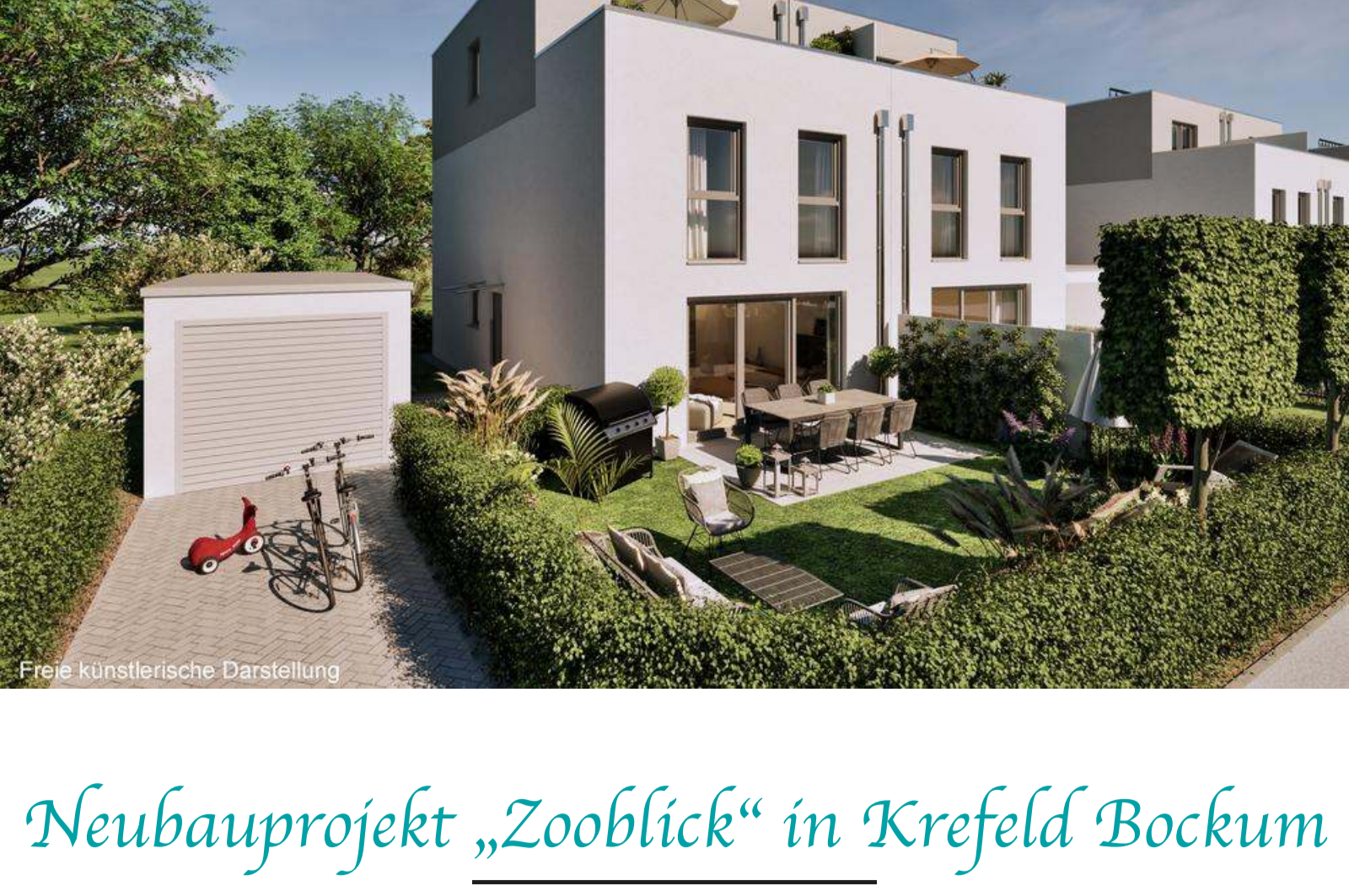
Freie künstlerische Darstellung