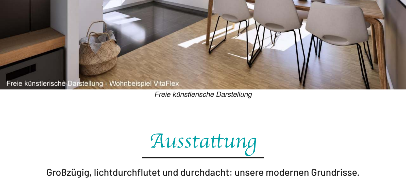
Freie künstlerische Darstellung - Wohnbeispiel VitaFlex

* Programm 297, 298 bis zu 150.000,00 € oder Programm 300 bis zu 270.000,00 € der KfW Bank. Die Konditionen können sich ändern