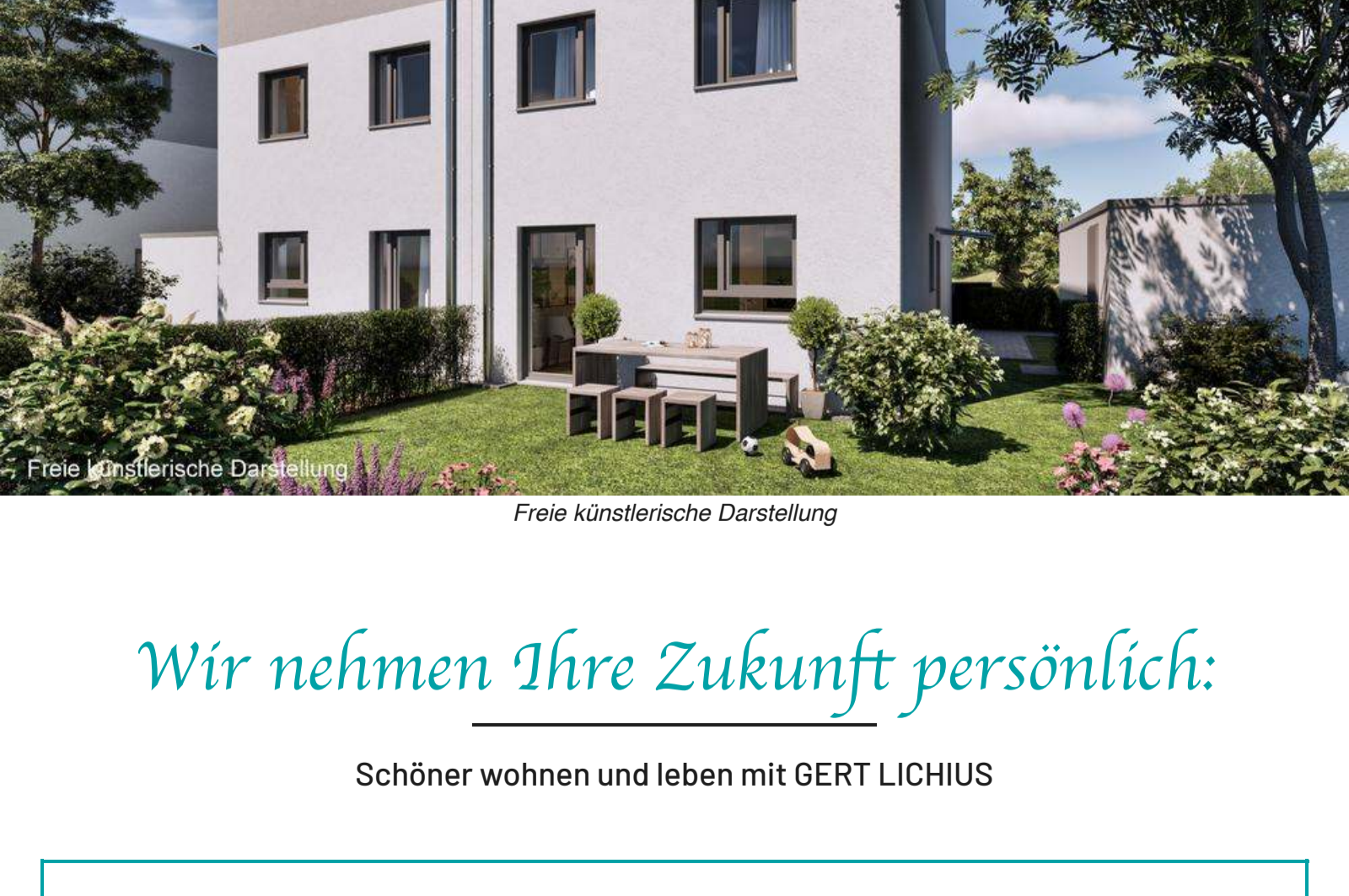
Freie künstlerische Darstellung

In direkter Nachbarschaft präsentiert der familienfreundliche Krefelder Zoo die unterschiedlichsten Ökosysteme. Hier entdecken Sie und Ihre Kinder immer wieder neue Highlights, wie z.B. im einzigen Schmetterlingsdschungel am Niederrhein.