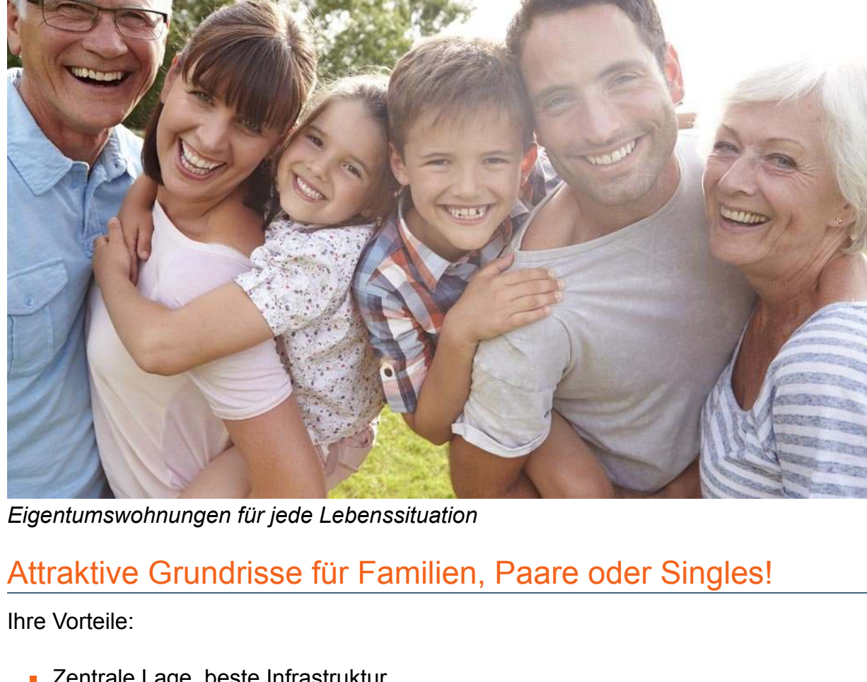
Eigentumswohnungen für jede Lebenssituation