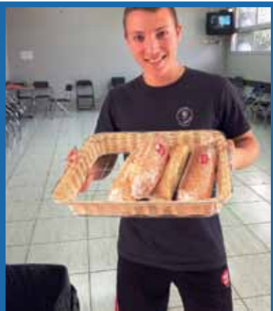
8. אל תאכל ארוחה כבדה לפני הריצה, הסתפק בפרי או שתייה, לאחר הריצה המתן כחצי שעה ואז אכול את הארוחה העיקרית.