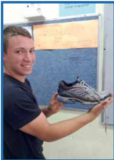
4. הצטייד כווג נעלי ריצה מתאימות וטובות, אל תחסוך בכך. נעלי הריצה כולמות זעזועים ומונעות פציעות אופייניות בכירכיים, בגב התחתון ובכפות הרגליים. קנה ביגוד ספורט מאוורר ומגדף זיעה.