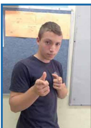
1. קבע לעצמך מטרה: פיתוח שרירים, ירידה במשקל, שיפור הכושר הגופני וכו'.