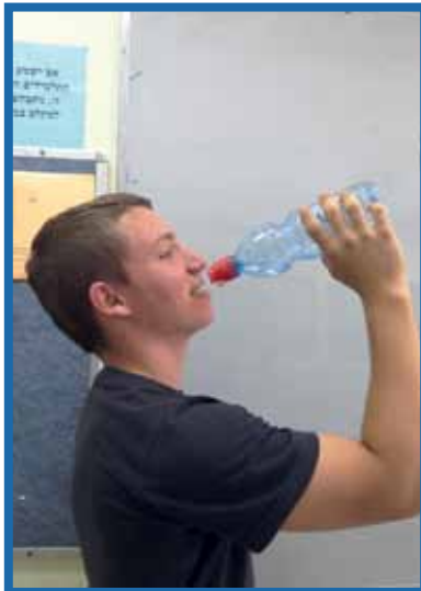
6. שתה מעט לפני הריצה, במהלכה, והרכה מאוד, מס' דקות לאחר סיום הפעילות.