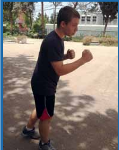
3. אם לא התאמת מעולם התחל ברמת עומס נמוכה מאוד, לדוגמה אם אתה רוצה לשפר את יכולת הריצה התחל בריצה משולבת עם הליכה, עד שתגיע לריצה רציפה.