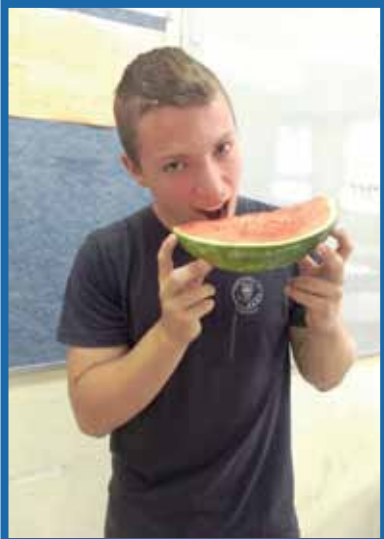
10. אכול הרבה פירות וירקות, הם מכילים סיבים תזונתיים הטובים לבריאות ולמערכת העיכול, ואף מסייעים לירידה במשקל ולביצועי ספורט טובים יותר.