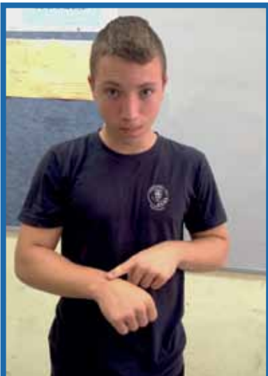
5. רוץ תמיד או בשעות הבוקר המוקדמות בין 6.00 ל-8.00 או בשעות הערב, כאשר מזג האוויר מתקרר.