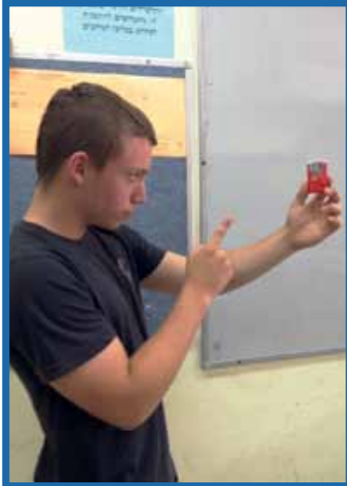
9. השתדל להמנע מאוכל מטוגן, אל תאכל בורקסים כלל! וכמובן המעט באכילת ממתקים.