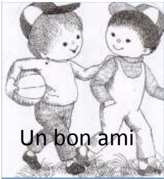
Un bon ami