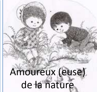
Amoureux (euse) de la nature