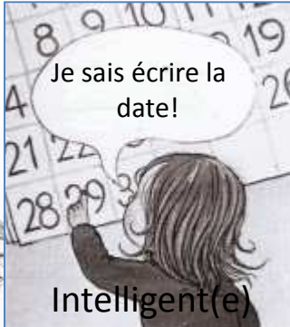
Je sais écrire la date!