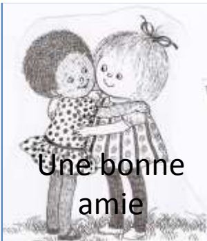
Une bonne amie