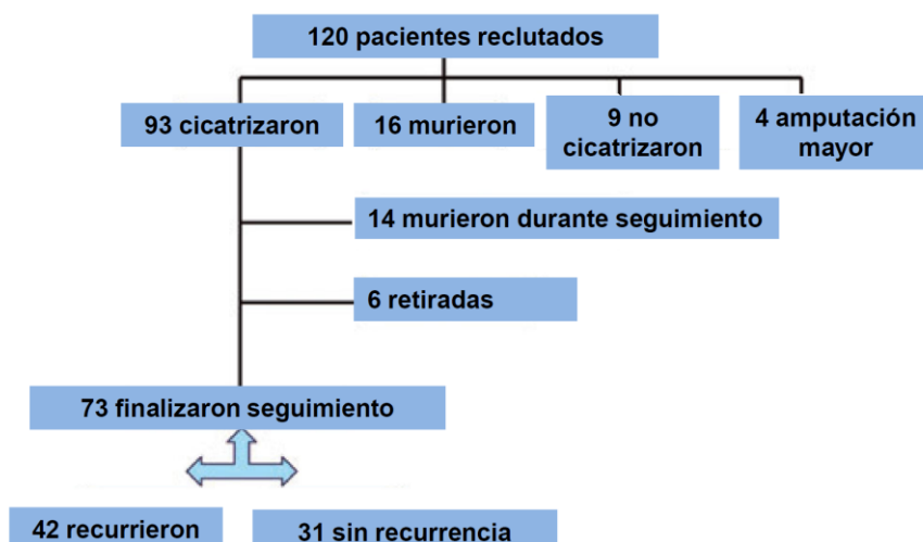
Figura 1. Diseño del estudio