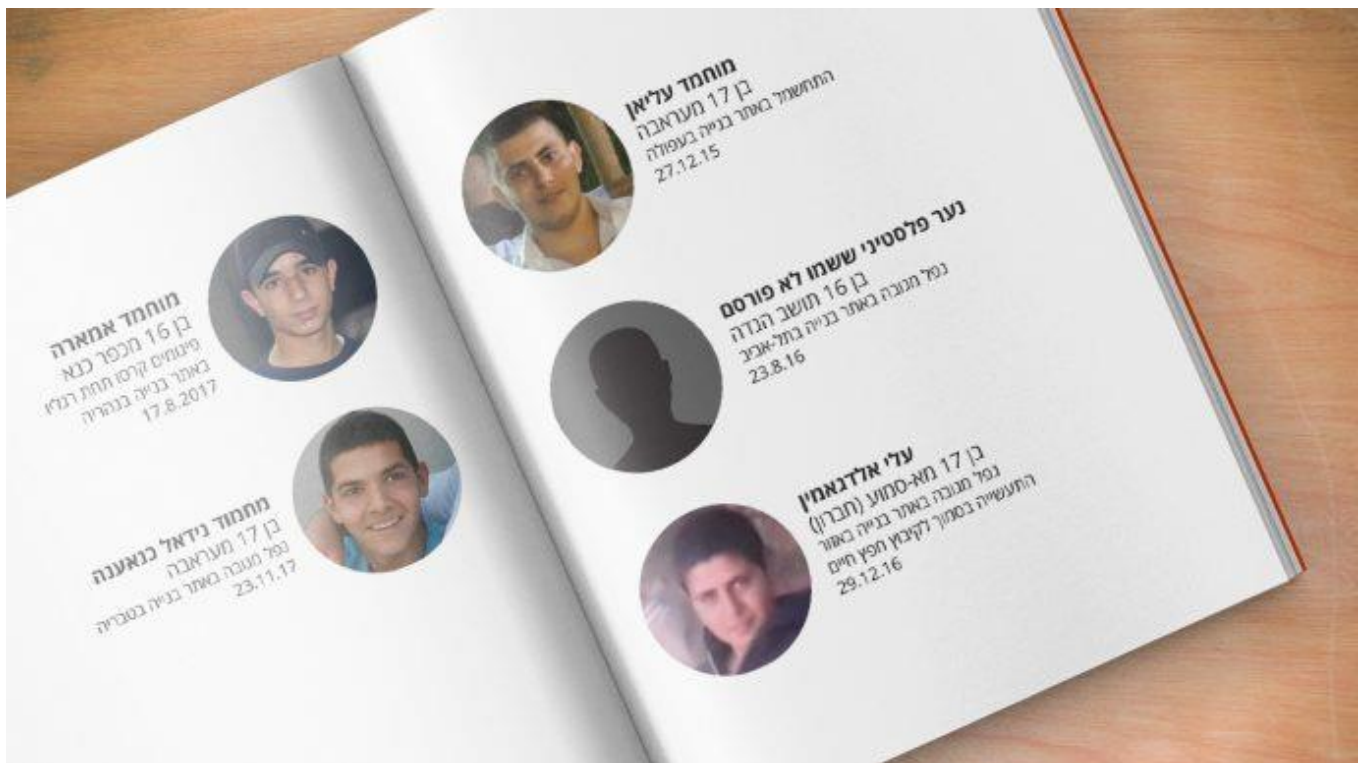
הנערים שנהרגו בענף הבניה בשנתיים האחרונות (גרפיקה: אידאה).

מאת ניצן צבי כהן עדכון אחרון: 15.05.2018, 19:27