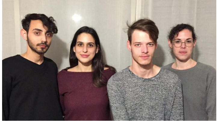
ועד הפעולה של התאגדות עובדי קפה נואר

עובדי המסעדה התל-אביבית הוותיקה, התאגדו בהסתדרות הנוע"ל בשלהי חודש פברואר האחרון, במטרה להבטיח את התנאים הסוציאליים המגיעים להם, ולהסדיר את תנאי ההעסקה במסעדה. למעלה ממחצית מעובדי המקום – כ-70 במספר – הצטרפו להסתדרות ודרשו מההנהלה להיכנס למשא ומתן על הסכם קיבוצי.