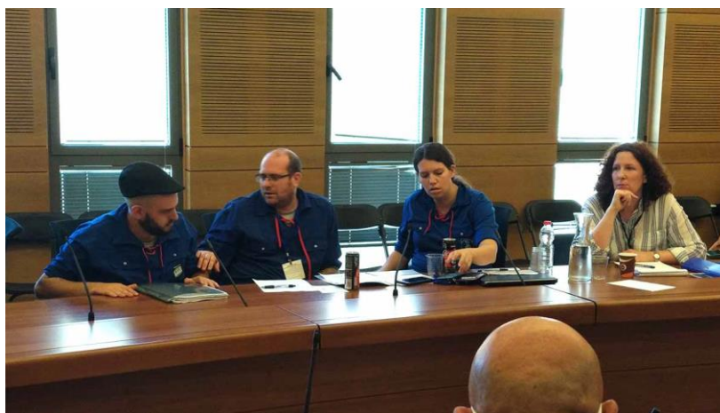
נציגי הנוער העובד בוועדה לשלום הילד – דיון על בני נוער הנפגעים באתרי בניה

חבר הכנסת דב חנין מתח גם הוא ביקורת נוקבת על מנגנון 'הערכת השפעות רגולציה (RIA) 'שמשרדי הממשלה מחוייבים בו בהתאם להחלטת ממשלה מאוקטובר 2014: "זו מערכת מתוחכמת של חסמים כדי למנוע הגנה על חיי אדם. הממשלה אימצה מנגנון קטלני שפוגע ביכולת לעשות רגולציה כדי להגן על חיי אדם, על בריאותם, ועל הסביבה – כדי להבטיח רווחים של בעלי הון. המנגנון הזה כרגע קושר את ידי הממשלה מאחורי הגב. זו מיטת סדום". חנין הוסיף כי אינו מתנגד להעברת החוק באמצעות הצעה פרטית ככל שהדבר אפשרי, אולם לדבריו יש להתיק גם את ידי הממשלה מהמנגנון המגביל – "בואו נתחיל מהרעיון היהודי הישן שכל דבר נדחה מפני פיקוח נפש. פיקוח נפש דוחה – RIA לדעתי זה צריך להיות חלק ממסקנות הועדה במכתב לשר הממונה."