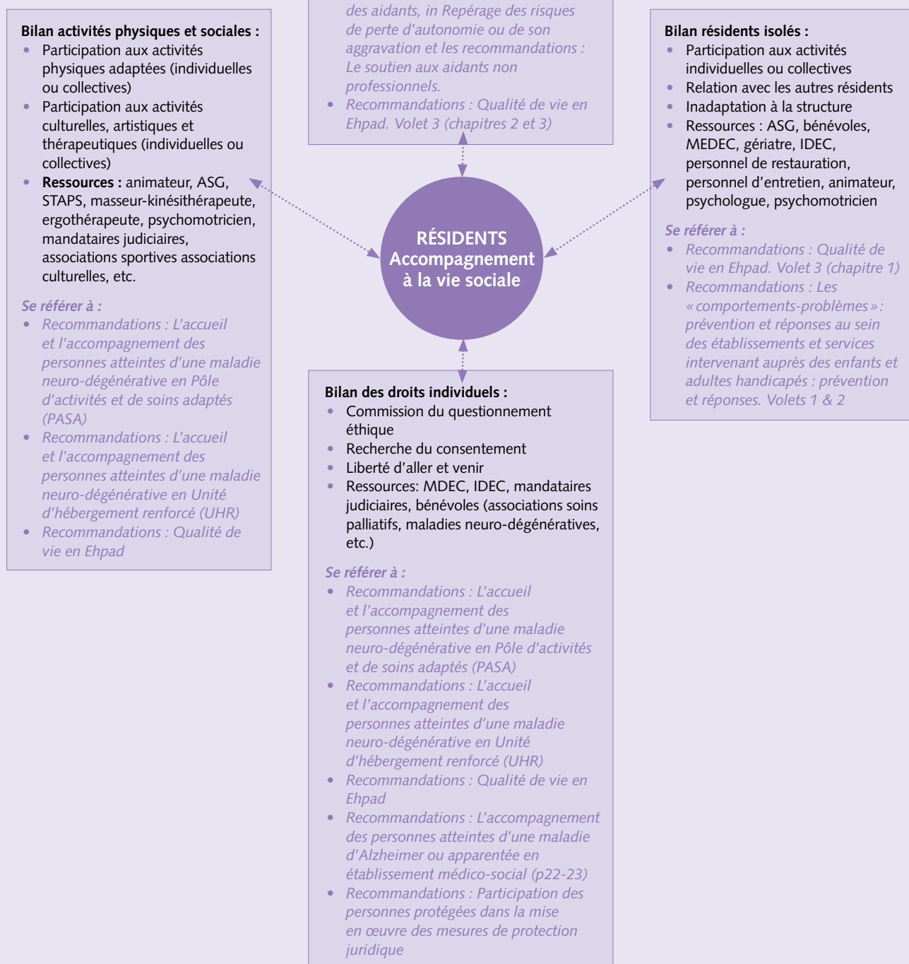
Schéma d'aide à l'identification des thèmes à prioriser. Volet accompagnement à la vie sociale