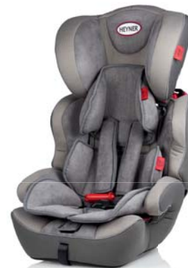
MultiProtect ERGO SP