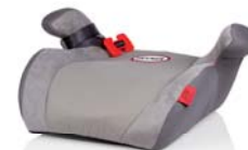
SafeUp M ERGO