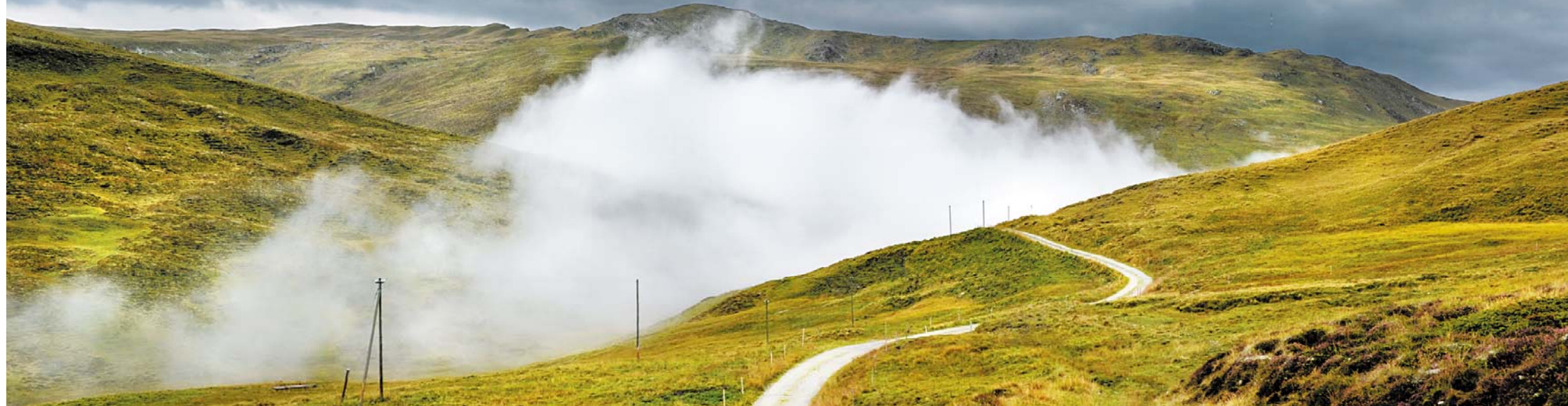
Auf der Alp Nova drehen bald Windräder

Im Lugnez soll der größte Windpark der Schweiz entstehen. In einem Landschaftsschutzgebiet VON LUKAS KISTLER