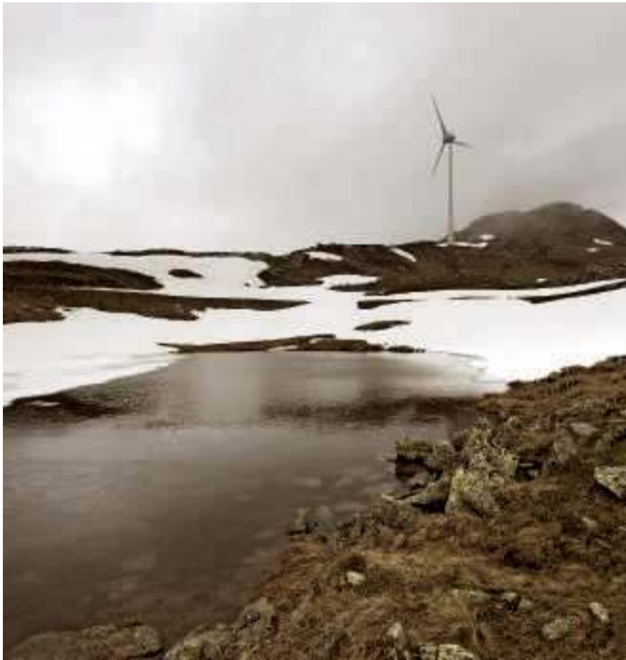
Eine Windanlage auf 2300 Metern auf dem Gütsch bei Andermatt.

Festgesetzt hat diesen Bonus der Bundesrat, als er unlängst neue Regeln für die kostendeckende Einspeisevergütung (KEV) für erneuerbare Energien festgeschrieben hat. Vom ersten bis dritten Quartal dieses Jahres betrug die ausbezahlte KEV-Gesamtvergütung knapp 220 Millionen Franken, an Windkraftanlagen gingen davon 6,5 Millionen. Der Löwenanteil kam Solarprojekten zugute.