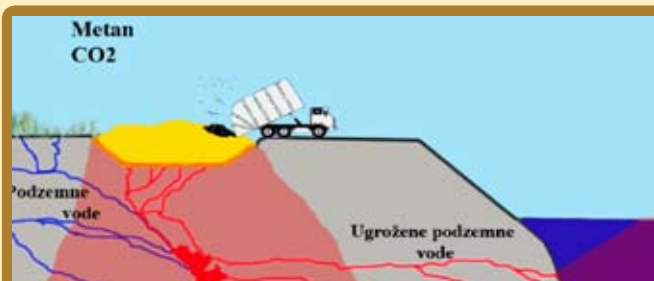
Odlagalište prije sanacije

Trenutno je u tijeku sanacija ovakvih odlagališta. Sanacija se provodi tako da se otpad postupno prevrće s trenutne pozicije te se pod njim postavlja prvo brtveni sloj koji ima za zadaću spriječiti propuštanje procjednih voda iz tijela odlagališta u tlo i tokove podzemnih voda. Iznad donjeg brtvenog sloja postavlja se drenažni sloj čija je funkcija sakupljanje procjednih voda i odvod istih do uređaja za pročišćavanje. Iznad površine zemlje, odnosno preko samog otpada, postavlja se takozvani pokrovni sloj, odnosno gornji brtveni sloj čija je zadaća, između ostalog, sprječavanje ispuštanja metana direktno u atmosferu. Ovakvu sanaciju propisuje Europska smjernica o odlagalištima otpada.