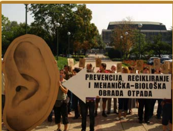
Aktivisti Zelene akcije prosvjedom ispred zagrebačkog Gradskog poglavarstva upozoravaju na potrebu poštivanja Hijerarhije gospodarenja otpadom.

Ovaj je redoslijed uspostavljen s obzirom na ukupnu ocjenu održivosti, odnosno ekološke prihvatljivosti. Navedena rješenja moraju se koristiti i crpiti tim redoslijedom, smanjujući svaki put količinu otpada za dalju obradu. Veliki broj europskih država nastoji reducirati količine otpada koje se odlažu na odlagališta, uslijed čega raste potreba za povećanjem udjela recikliranog i biološki obrađenog otpada u ukupnoj količini nastalog otpada 4 .