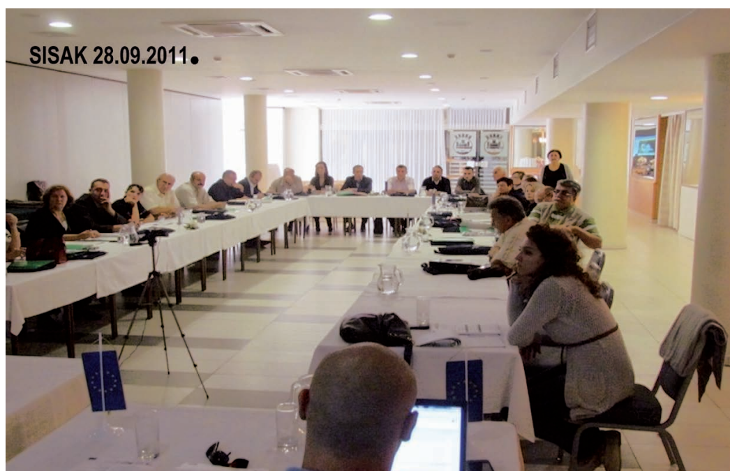
Radionica u Sisku

Nakon raspada Socijalističke Federativne Republike Jugoslavije 90-tih godina, Sava i njen sliv dobili su međunarodni karakter. Značaj slivnog područja rijeke Save za sve zemlje sliva vidljiv je i u tome što je ubrzo prepoznata potreba za suradnjom zemalja bivše Jugoslavije u upravljanju zajedničkim vodama slivnog područja Save. Okvirni sporazum o slivu rijeke Save (u daljnjem