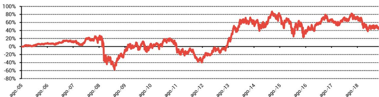
Se han realizado cambios sustanciales en los años 2009, 2010, 2012 y 2015