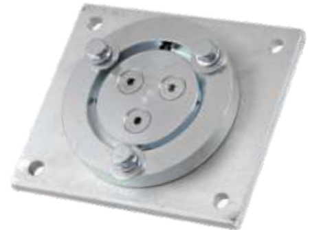
Le socle pivotant permet une rotation de l'enrouleur sur 345°

Si les opérateurs laissent l'énergie du ressort rembobiner le câble sur l'enrouleur de manière indépendante, l'énergie des impacts répétés aura pour effet d'endommager soit le câble soit l'enrouleur et risque de blesser l'opérateur.