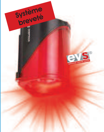
L'effet EVS* permet d'attirer l'attention de manière efficace