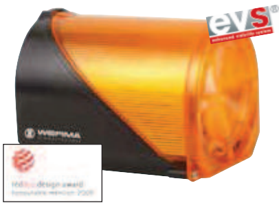
Fixation sur fond plat