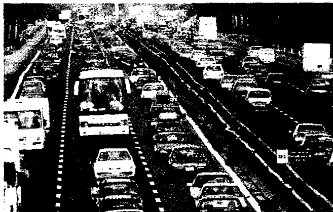
Anche questa estate l'auto sarà il mezzo preferito dagli italiani.

Se i vacanzieri aumentano resta ancora ragguardevole il numero degli "esclusi": rimarranno a casa oltre 13 milioni di italiani (il 23% del totale) o per