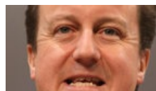
L'imbarazzante pisolino di David Cameron