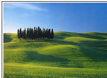
La Toscana è la più amata

presenti sui cataloghi dei tour operator con in prima linea la Toscana, il Lazio e il Veneto. Ma quali sono i comportamenti turistici e di consumo dei viaggiatori statunitensi che scelgono di soggiornare in Italia? Le indagini dell'Osservatorio Nazionale del Turismo Unioncamere - ISNART rilevano proprio le peculiarità dei turisti provenienti dagli Stati Uniti. L'Italia è considerata una meta ideale per rigenerarsi (25,4%) e scoprire luoghi nuovi (20,8%), ma anche per toccare con mano le bellezze naturalistiche (16,9%) e storico-artistiche locali (15%). Inoltre,