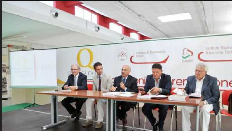
Il tavolo della giunta camerale