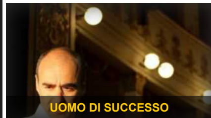
UOMO DI SUCCESSO