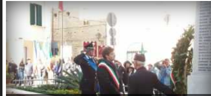
ONORE AI CADUTI