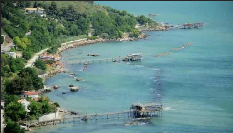
Costa dei Trabocchi