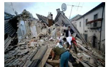
16 Gennaio 2017 – Collegio Geometri e Camera Commercio Ascoli, convegno sulla ricostruzione post-sisma