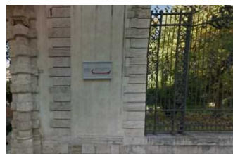
08 Febbraio 2017 – Camera di Commercio: sostanziale tenuta nel bilancio 2016 delle imprese picene