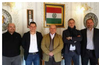
15 Marzo 2017 – Camera Commercio Ascoli, al via corso per assaggio olio