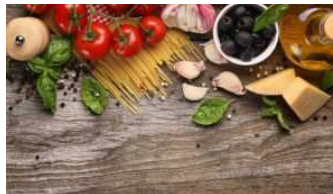
Tursimo, Coldiretti: alimentari primo obiettivo di spesa, battono souvenir, moda e artigianato

che riguarda il 25,9% dei visitatori francesi, il 22,5% di quelli tedeschi e il 16,9% di quelli del Regno Unito secondo una ricerca Bit/Bocconi. Una tendenza che assegna all'Italia la leadership nel turismo enogastronomico conquistata – conclude la Coldiretti – grazie a quasi 60mila aziende agricole biologiche, ma anche per le 294 specialità Dop/Igp registrate a livello comunitario, i 523 vini Docg, Doc e Igt e i 5.065 prodotti tradizionali censiti dalle regioni.