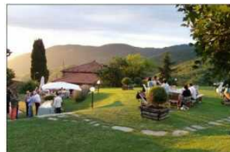
Turismo: Coldiretti, spese a tavola record a 12 MLD, voce n.1 budget