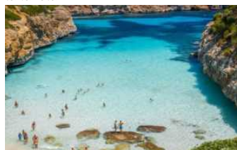
Caldo: Coldiretti, a luglio in partenza 15,2 mln di italiani (+1%)