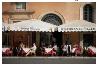
Vacanze: Coldiretti, spesa di 803 euro, più per cibo che alloggio