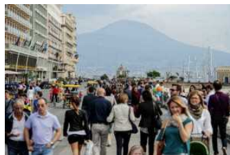
Turismo: Coldiretti, 1/3 spese per tavola, supera l'alloggio