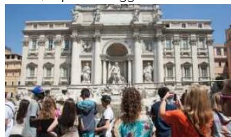
In Italia 1/3 budget turistico speso per la tavola