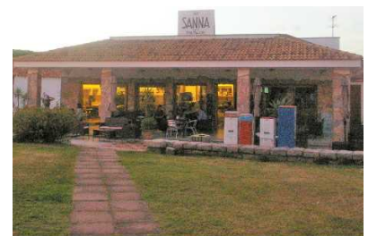
AGLIENTU, RENA MAJORE: "BAR SANNA" SI VA A...TUTTA BIRRA