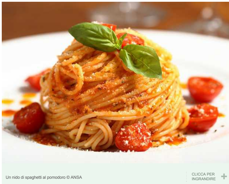
Un nido di spaghetti al pomodoro