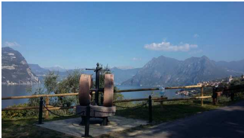
Frantoio di Monte Isola (BS)

Un passo dopo l'altro, alla scoperta di piante secolari e di un mondo antico, dove l'eccellenza di un prodotto modella l'identità stessa del paesaggio. La Camminata tra gli olivi vuole essere tutto questo e nell' Anno del Cibo Italiano riportare alla ribalta, con la seconda edizione domenica 28 ottobre , la qualità e il valore dell'olio extravergine, degli olivicoltori e dei territori.