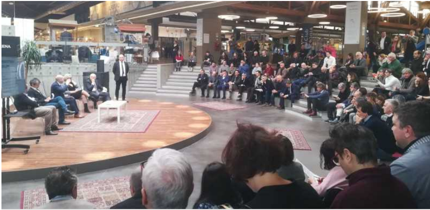
L'assemblea a Fico Bologna

Strada della Romagna insieme alle Strade dei Vini d'Italia per un enoturismo di qualità Il Coordinamento nazionale delle Strade del Vino, dell'Olio e dei Sapori d'Italia si è riunito alla Fondazione FICO di Bologna per fissare gli obiettivi del 2019. In prima linea la Strada della Romagna per sostenere un turismo fortemente basato sulle eccellenze dell'agricoltura locale