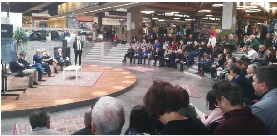
L'assemblea a Fico Bologna

Strada della Romagna insieme alle Strade dei Vini d'Italia per un enoturismo di qualità Il Coordinamento nazionale delle Strade del Vino, dell'Olio e dei Sapori d'Italia si è riunito alla Fondazione FICO di Bologna per fissare gli obiettivi del 2019. In prima linea la Strada della Romagna per sostenere un turismo fortemente basato sulle eccellenze dell'agricoltura locale