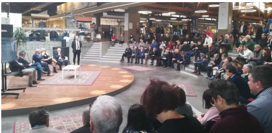
L'assemblea a Fico Bologna

Strada della Romagna insieme alle Strade dei Vini d'Italia per un enoturismo di qualità Il Coordinamento nazionale delle Strade del Vino, dell'Olio e dei Sapori d'Italia si è riunito alla Fondazione FICO di Bologna per fissare gli obiettivi del 2019. In prima linea la Strada della Romagna per sostenere un turismo fortemente basato sulle eccellenze dell'agricoltura locale