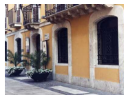
CASA NATALE DI GABRIELE D'ANNUNZIO