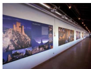
MUSEO DELLE GENTI D'ABRUZZO