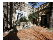
MUSEO CIVICO BASILIO CASCELLA