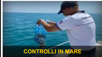
CONTROLLI IN MARE