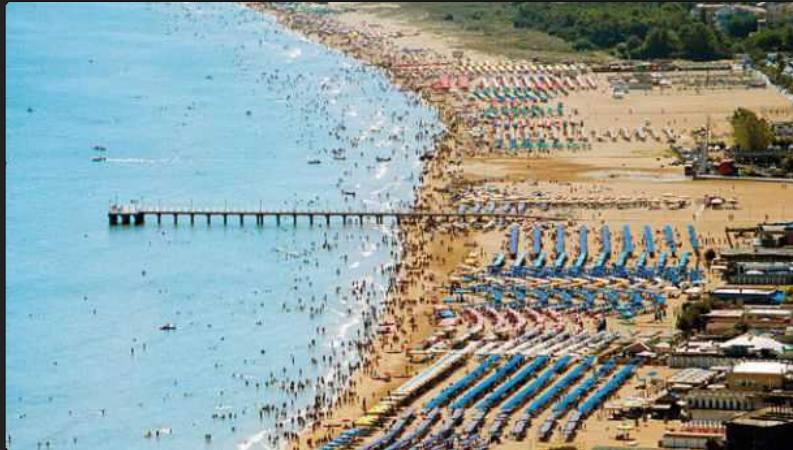
La spiaggia di Vasto Marina