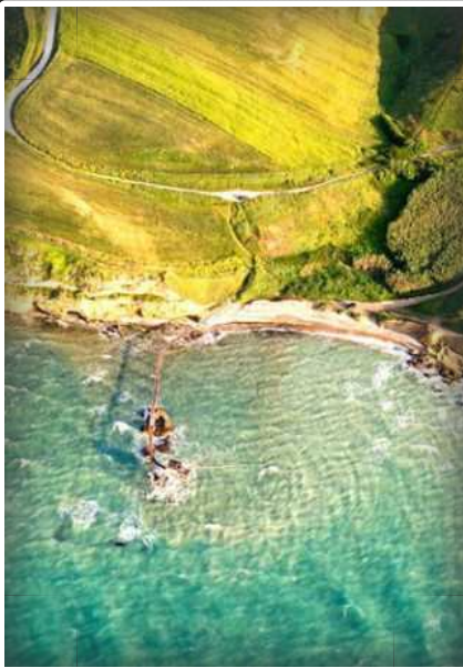
Vasto il mare per le tue Vacanze...