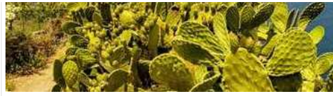
Un'immagine delle Isole Eolie

milioni di italiani che si muoveranno per le vacanze, l'86% rimarrà entro i confini nazionali e la maggior parte, sempre secondo le proiezioni,