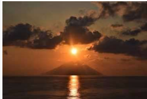
Un'immagine del vulcano di Stromboli

Un'anima divisa in due, tra la natura più selvaggia e i piaceri dei sensi, tra le acque più limpide e le cime più alte, è quella di Filicudi che riassume i suoi contrasti con la bellezza che solo la libertà di fare quello che si vuole può regalare. Gite in barca per immergersi nel mare mozzafiato della grotta