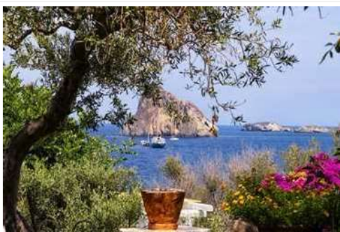
Un'immagine delle Isole Eolie

Troppa tranquillità spaventa? È sufficiente cambiare sponda e approdare su quella vivacissima di Panarea, la più mondana delle Eolie, dove il divertimento si alterna al passo lento che caratterizza le spiagge sabbiose di Cala Junco e Cala Zimmari, in cui i fiori esplodono da ogni fessura lungo gli stretti percorsi da fare rigorosamente a piedi, inebriandosi del sentore di camomilla e di limoni, in assoluta solitudine. Ma fino al calare della sera quando la vita notturna isolana, con il suo carico di vip e bellezze da tutto il mondo, vivacizza i locali di San Pietro. Nessuna paura di contagio, sia chiaro. Solo di non riuscire a soddisfare ogni desiderio del palato, destinato a essere sedotto dal pesce tipico dell'isola, lo scorfano, cucinato con le "orchidee delle Eolie", frutti simili a piccoli cetrioli, da gustare da soli come aperitivo o come ingrediente principe dei piatti tradizionali eoliani.