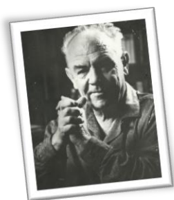
NP van Wyk Louw