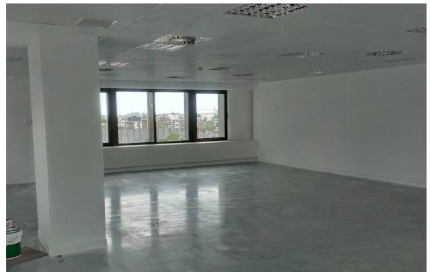
Oficinas En Centro Norte, C/ Agustín De Foxá 27, Madrid