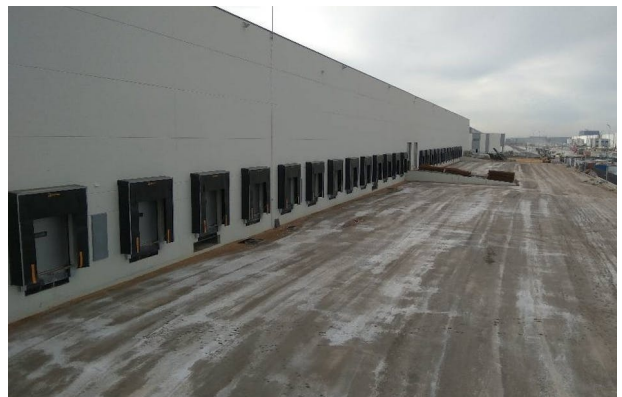
CABANILLAS PARK I - NAVE A, Avda. La Veguilla 5, Cabanillas Del Campo